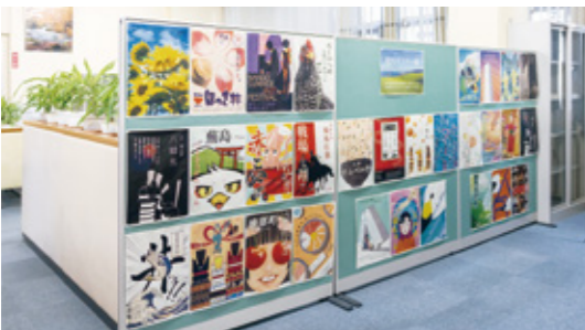
地域の高校生が制作した「青森県南地方の観光ポスター」展示ギャラリーをロビーに設け、地域との関わりを深めている。

また、私たちはコロナを「災害」と捉えています。借入が増加している企業へ対処するためには、メインバンクだけでなく、公庫を含む金融機関全体で支える体制が必要で、融資に頼りすぎない再編計画や事業再生計画についても、金融機関だけではなく、商工会議所などの関連機関と連携しながら、これまで以上に相談しやすい問口の広さと持続性を重視したサポートを心がけてまいります。