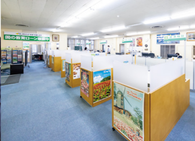
関係機関と連携した起業・創業に関わる相談や融資業務のほか、個人向けの「国の教育ローン」の窓口として通年で申し込み受付を行っている。

当庫は2008年に国民生活金融公庫、農林漁業金融公庫、中小企業金融公庫の統合により、財務省所管の政策金融機関の一つとして設立されました。かつて国民生活金融公庫として知られていた当庫は、特に中小企業支援を通じて戦後の経済成長に貢献してまいりました。 私が入社したのはバブル経済が花開いた平成元年でした。多くの先輩が在籍していましたし、今では想像できないほど多くの同期とともにキャリアをスタートしました。入社当初は毎日多くのお客様が来店されていましたから、仕事は融資審査が中心でした。しかし、バブル崩壊後、来客も激減。これまでとは違うニーズの掘り起こしとして、創業支援や地域ブランドのPR、商談会開催など、従来の融資業務を超えた取り組みが次第に多くなってきました。しかし、お客さまとの信頼関係づくりや課題解決のお手伝いは、本来の金融業務の根っこなんだな、と振り返っています。 仕事柄、全国さまざまな都市での赴任実績が財産となっています。中でも八戸市と共通の問題を抱えていた前橋市で