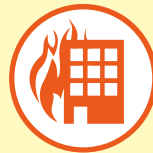
火 災 ...etc.