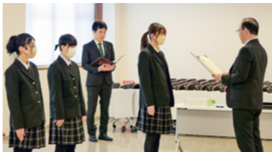
創業マインドの向上を目指した「高校生ビジネスプラン・グランプリ」。昨年は八戸高専ビジネス愛好会がベスト100に入賞した。