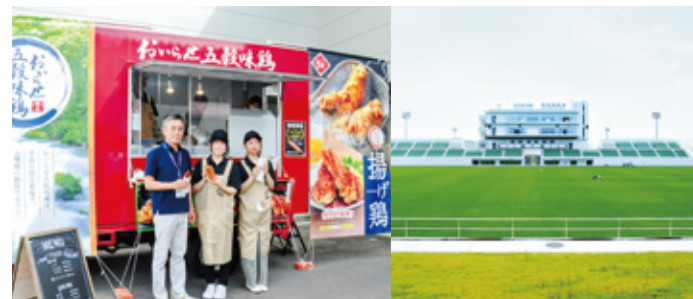
プライフーズスタジアムをはじめ、応援している地域のスポーツチームの試合会場などに駆けつけるキッチンカー。自社商品を使ったメニューなどが大好評。