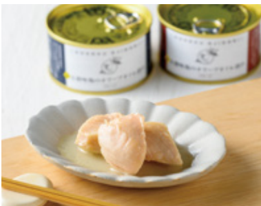
飼料からこだわって育てた鶏の胸肉を使用した新商品「五穀味鶏のオーリーブオイル漬け」。

係先と協議と研究を重ね、段ボールもプラスチックトレーも不要、かつ鮮度を保てる真空包装で消費者が直接手に取るところまでを工場内で作り上げるリターナブルな仕組みを実現しました。 地域を盛り上げ、未来を育てる活動も地域企業の役割として注力しています。スタジアム運営やスポーツチームのサポート、最近では自社商品を調理販売するキッチンカーを導入し、活動に彩りを加えています。7月に取得した南郷地域での事業展開には、お子さま連れの家族が当社商品を調理・実食できる体験型施設を備え、南郷の自然環境と食育を通じた地域と人と食の絆を深める取り組みにも挑戦していく予定です。 私自身、商社勤務時代から世界各国を巡ってきた中で、大切にしている「フェアネス」という信条があります。ビジネスの物質的な側面しか見えていなかった駆け出しの頃、海外の取引先担当者から指摘された言葉です。どんなポジションでも、誠実さ、謙虚さを持って行動し、常に自問しながら、企業文化を高める指標のひとつとしています。