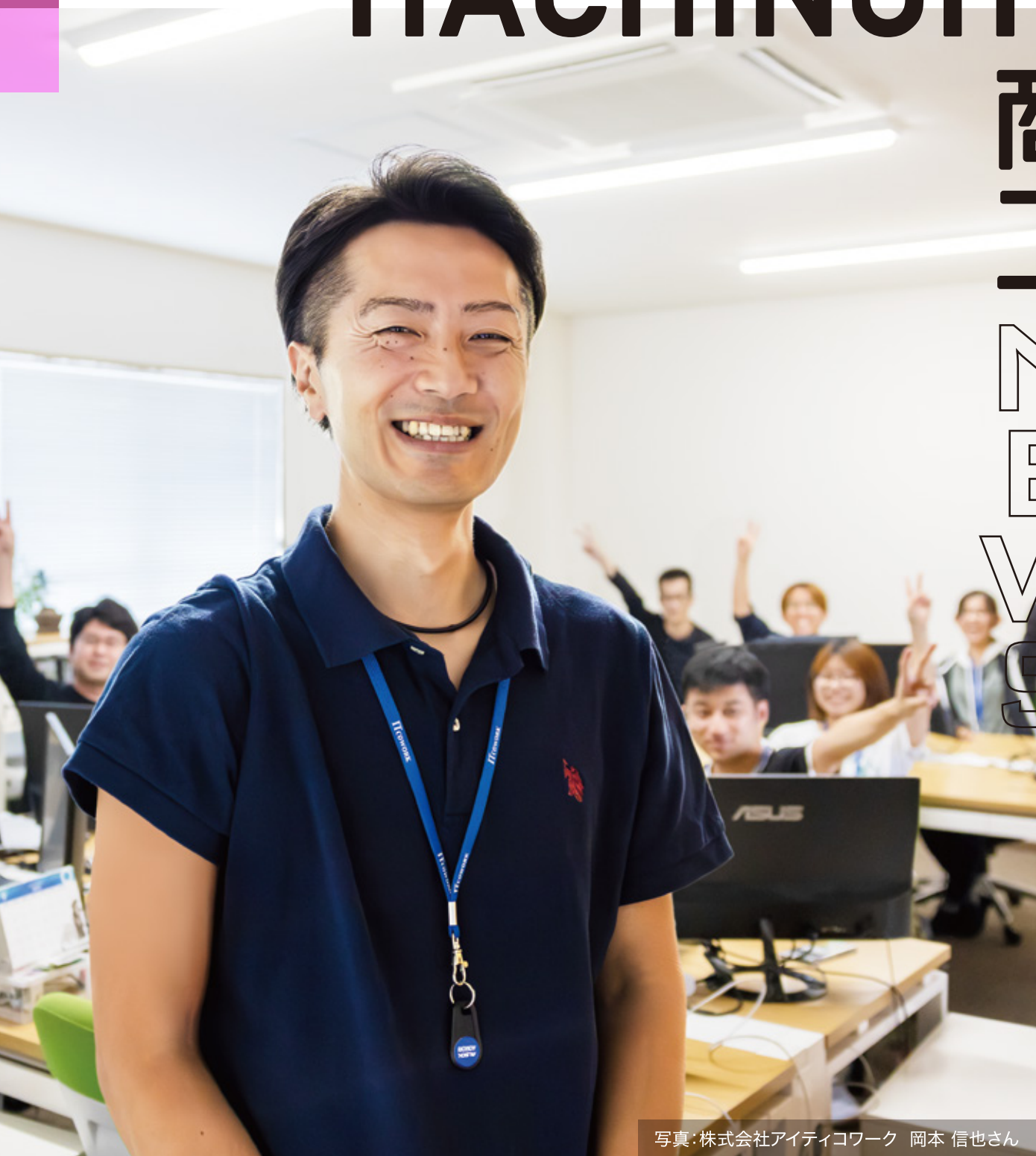
写真:株式会社アイティワーク 岡本 信也さん