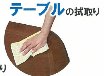
テーブルの拭取り