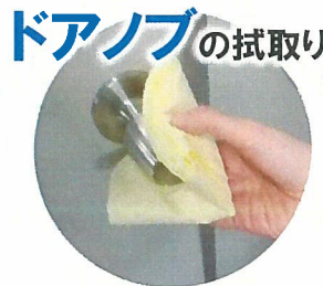
ドアノブの拭取り