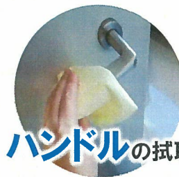
ハンドルの拭取り