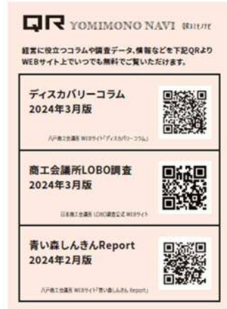
はちのへ商工ニュース▶