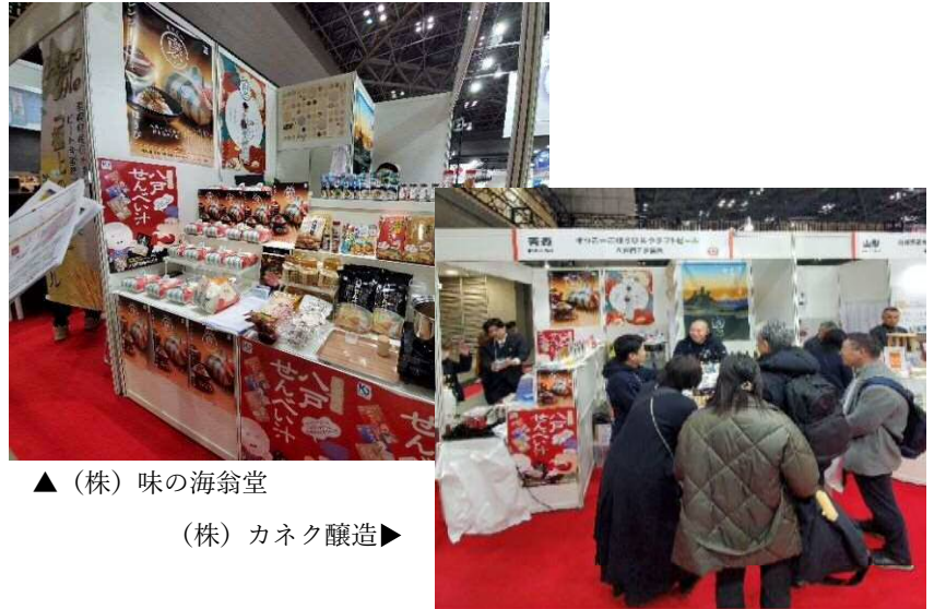
▲（株）味の海翁堂 （株）カネク醸造▶