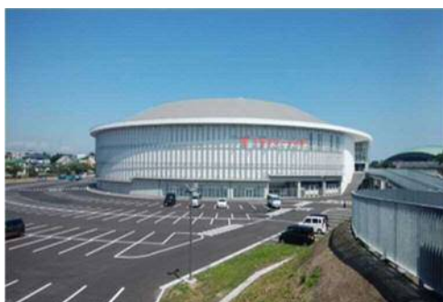
▲会場のYSアリーナ八戸 個別商談会のようす▶