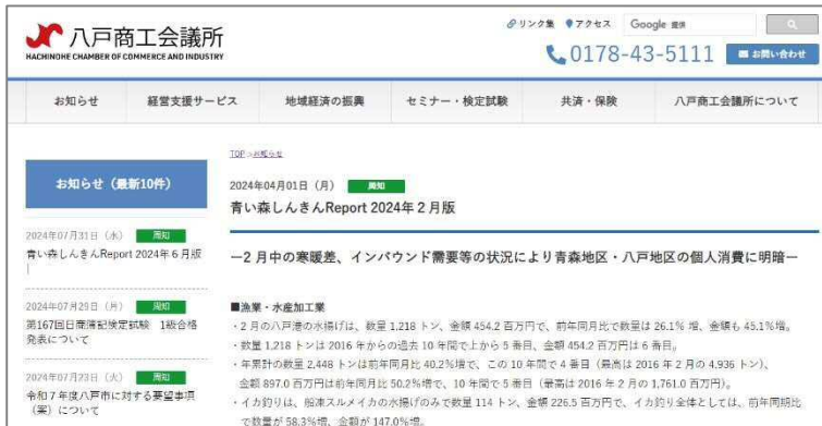
▲当所 Web サイト